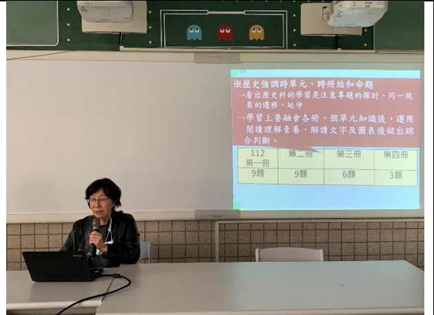
盛素卿老師說明分享