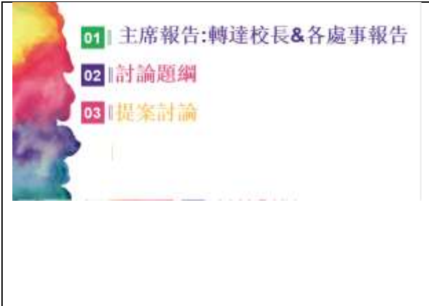
主席引導教學研究會流程