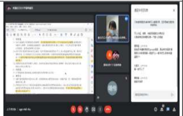
學務處主任說明學務處報告事項