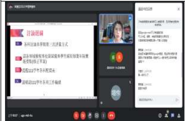
社會科教師進行議題討論