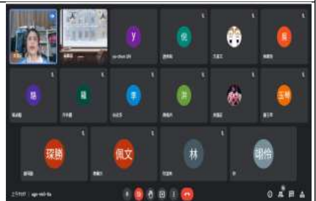
參與教學研究會之教師