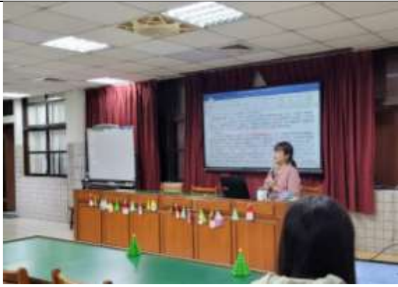
主席引導教學研究會流程