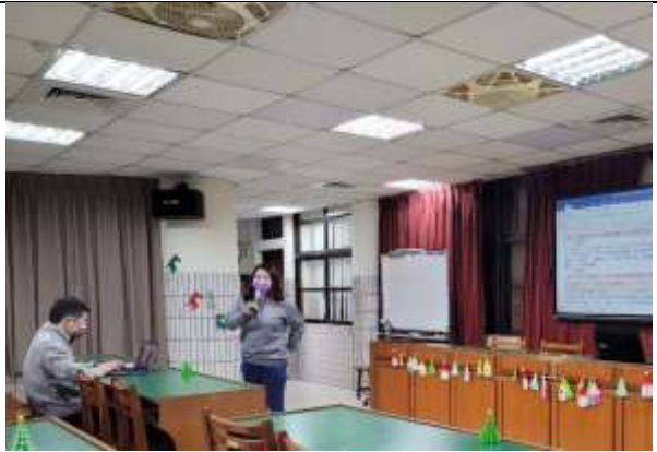
總務處主任說明總務處報告事項