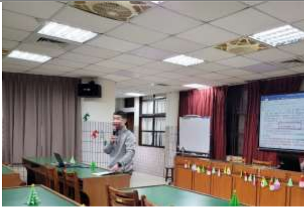
總務處主任說明總務處報告事項