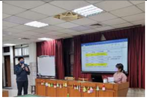
學務處教官說明學務處報告事項