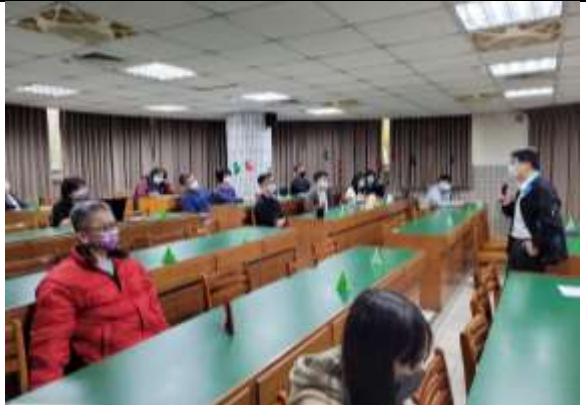
參與教學研究會之教師