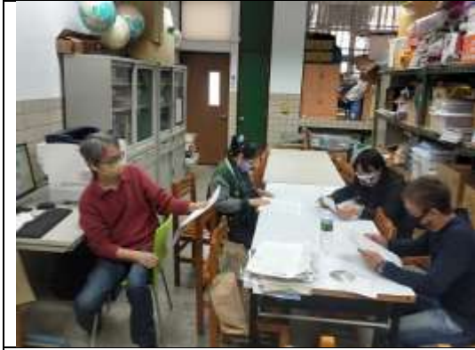
各科分別說明試題分析結果