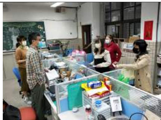
各科分別說明試題分析