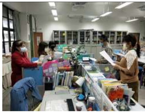
各科分別說明試題分析