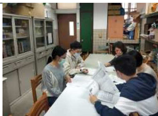
社會科成員試題分析研會議結束合影