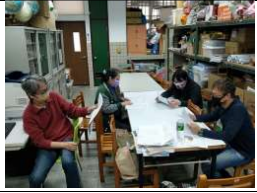
社會科成員試題分析研會議結束合影