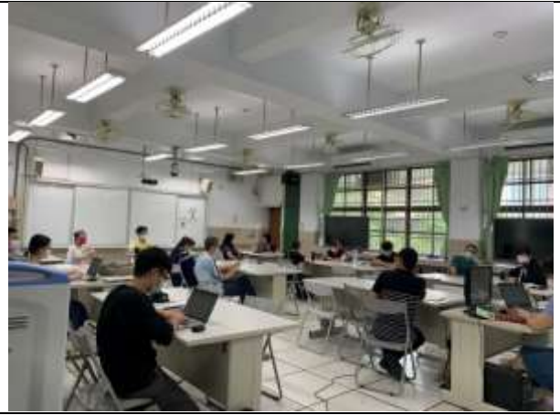
教師就題綱進行討論