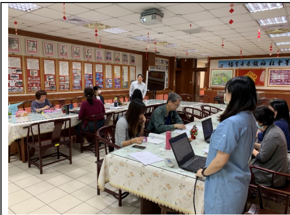
總召主持與校長勉勵