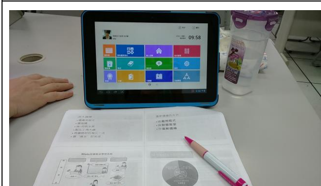
智慧教室搭配平板電腦操作學習。