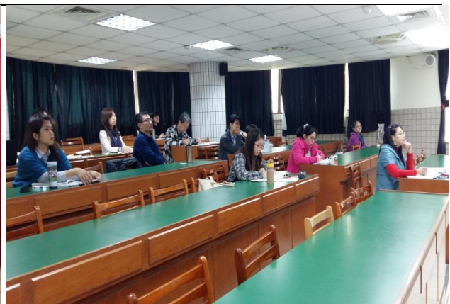
照片說明：社會科教師聚精會神聆聽分享