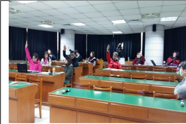
照片說明文：提案表決