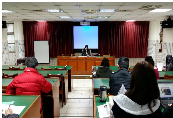
照片說明文：校長指導