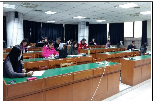
照片說明文：討論共同備課行事曆