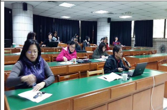
照片說明文：洪鼎堯師進行學測試題分析報告