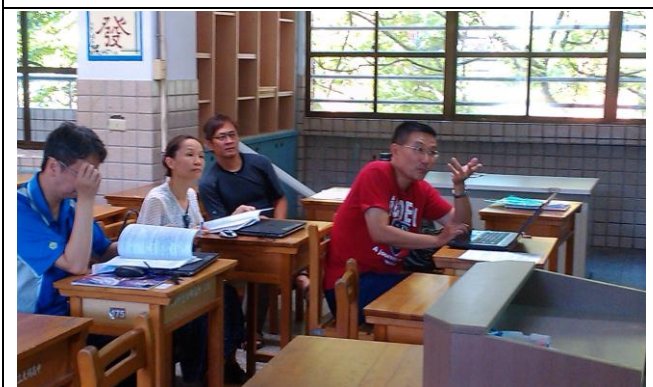
照片 7：指考試題分析(歷史科)