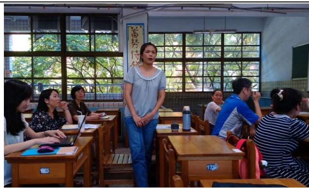
照片 4：新進同仁介紹