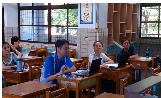
照片 8：指考試題分析(地理科)