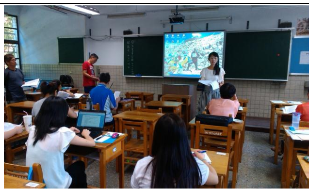
照片 2：圖書館主任報告