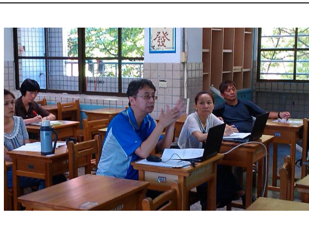
照片 6：指考試題分析(公民科)