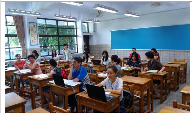
照片 3：實習老師介紹