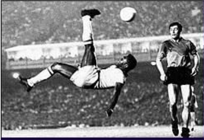
1957年，巴西隊在國際足球錦標賽決賽中，以1比0擊敗英格蘭隊，奪得冠軍。