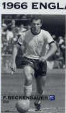
F. BECKENBAUER 西德

在1966年世界杯決賽中，英格蘭隊以4-2擊敗西德隊，第四次奪得世界盃冠軍。這屆杯賽，英格蘭隊展現了極強的體能和戰術執行力，中場核心貝利（Pelé）更是攻入5球，成為奪冠的最大功臣。此外，英格蘭隊在比賽中展現了極強的體能和戰術執行力，這也是他們在足球史上的一個重要時刻。