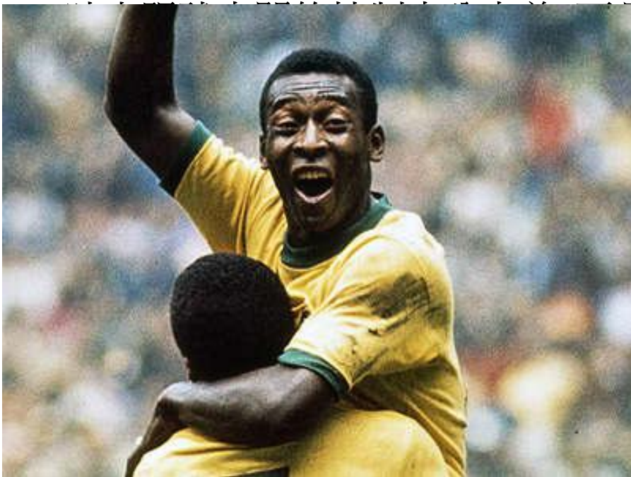
1958年，巴西隊在國際足球錦標賽決賽中，以5比2擊敗法國隊，奪得冠軍。