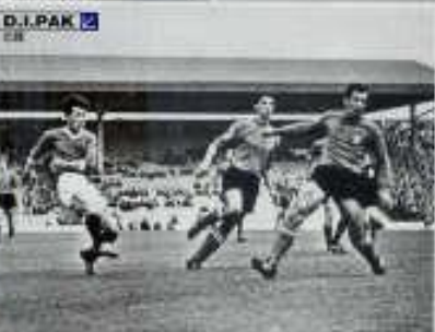
D. I. PAK 捷克斯拉夫

這屆杯賽在英格蘭舉行，是足球史上的一個重要時刻。英格蘭隊在決賽中展現了極強的體能和戰術執行力，最終奪得冠軍。這屆杯賽也見證了許多精彩的比賽和球員的出色表現。