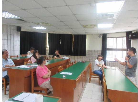
照片說明文：老師向總務主任反應狀況