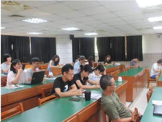
照片說明文：專心聆聽各處室宣導內容