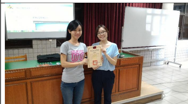
范秀儀老師頒發感謝狀