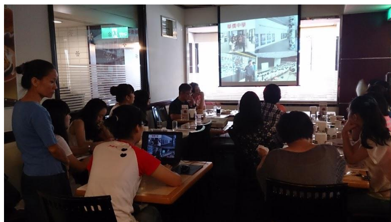
林俞君老師 課程簡介

4. 強調學生能多元發展，例如學生若選擇理工類課程為主修時，亦必須搭配人文類課程為部分選修。