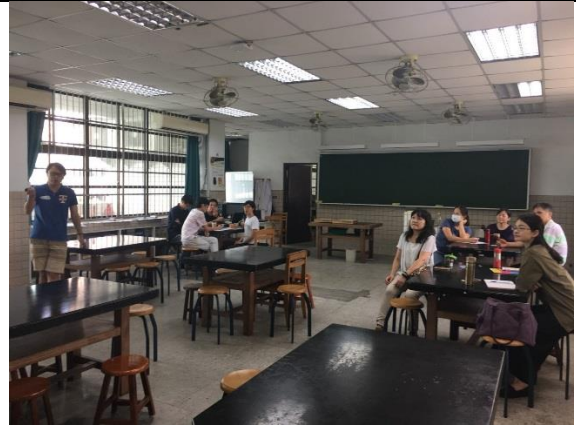
參與教師專心聽講