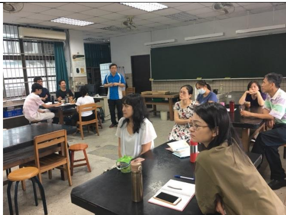
設備組長說明財產移轉事宜