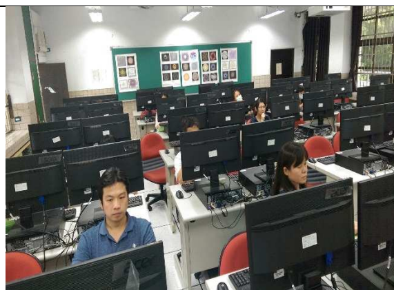
老師們認真聽講的樣子