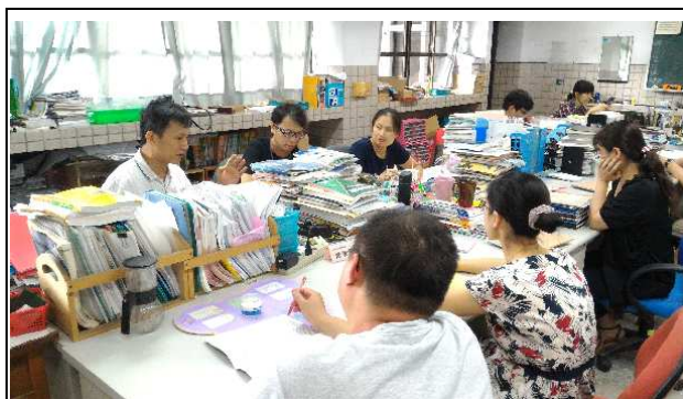
化學科六位教師在自然科辦公室共備