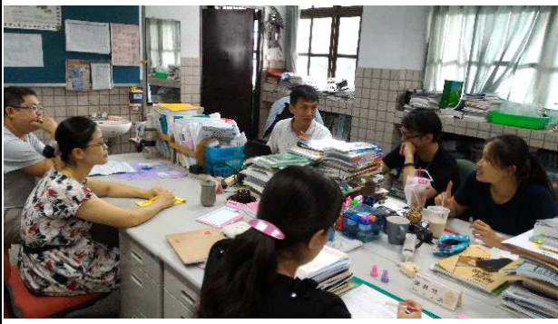
化學科六位教師在自然科辦公室共備