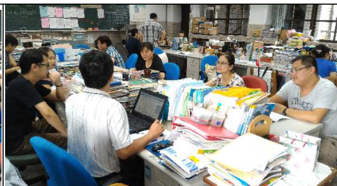
化學科六位教師在自然科辦公室共備