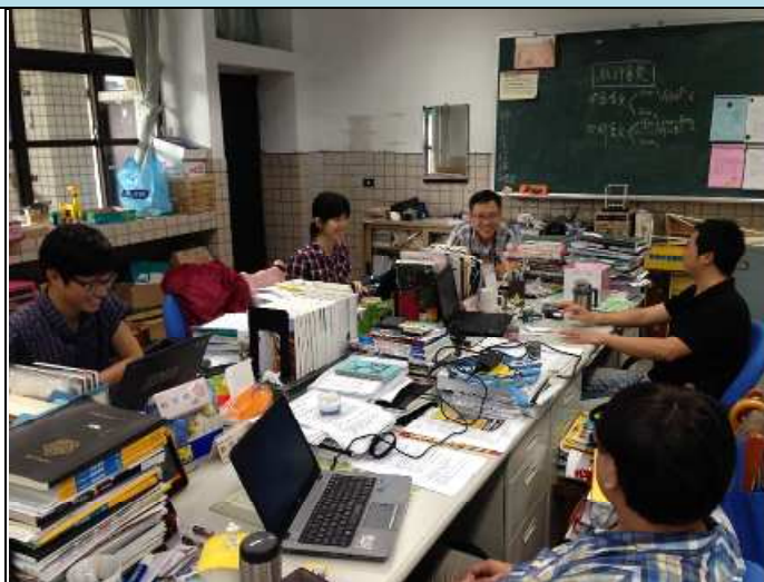
教師們進行討論中 1