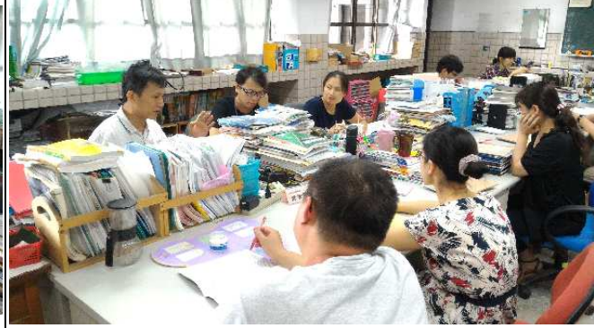
化學科六位教師在自然科辦公室共備