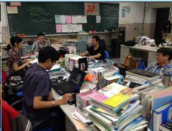
教師們進行討論中 2