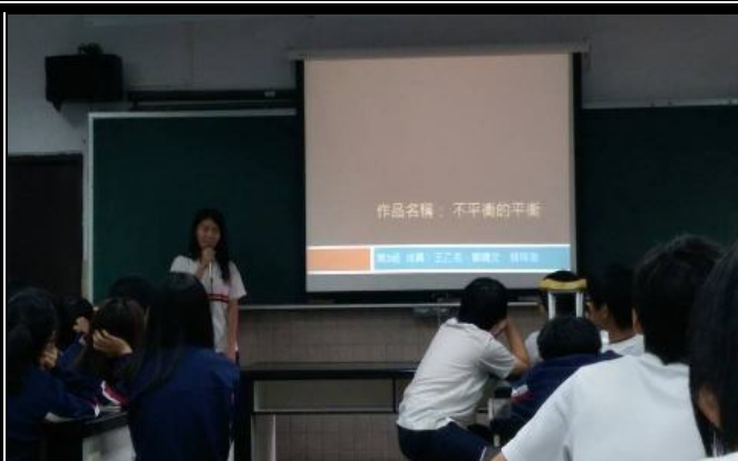
學生們認真報告的樣子 2