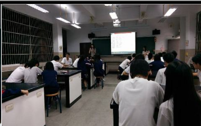
老師叮嚀同學上台及評分注意事項