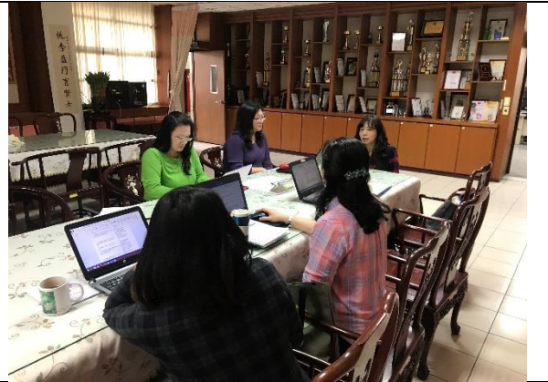
何主任叔俞列席指導噢。