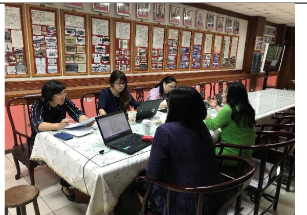
吳主任致娟列席指導。