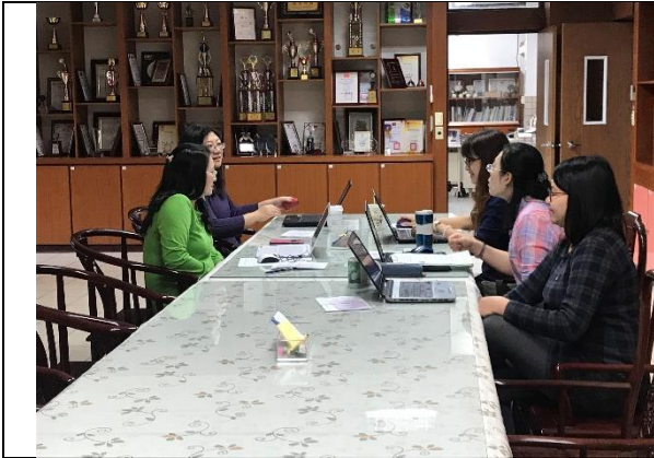
召集人 姵蓉師宣達聯席會議重點。