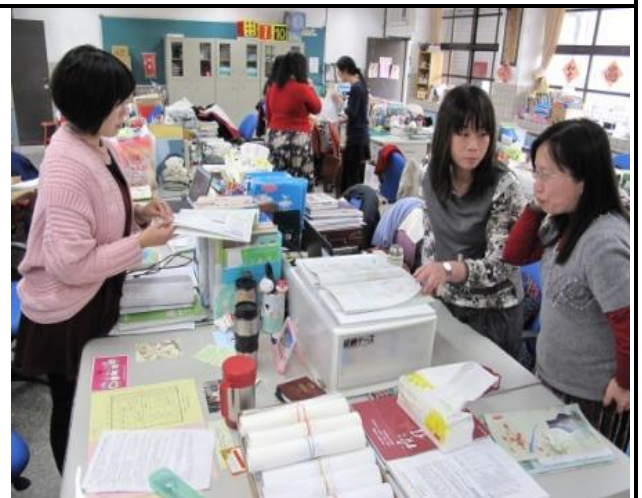
國八教師分組討論