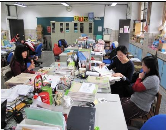
國七教師分組討論