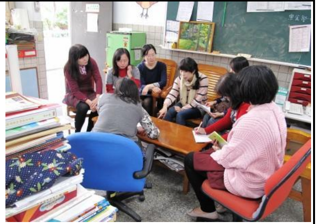
召集人說明今日工作坊主題