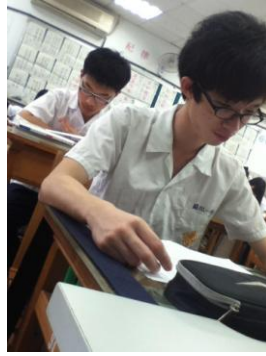
(圖三)(圖四) 學生觀看老師批閱之後的作文評語