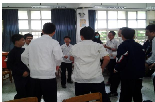
營火會節目討論與練習