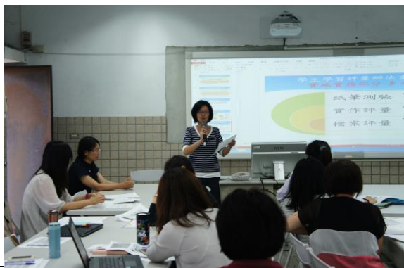
郁芬老師分享寫作翻譯評量