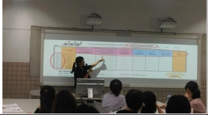
玉屏選修 rubrics 評量分享