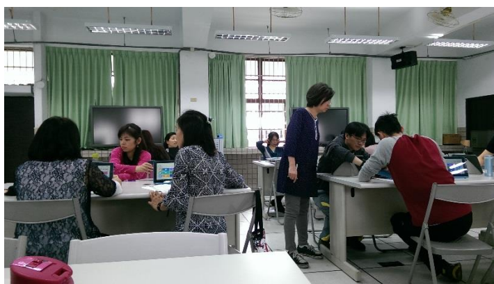
夥伴之間彼此協助解決難題