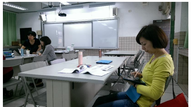
老師確認軟體安裝與執行情形