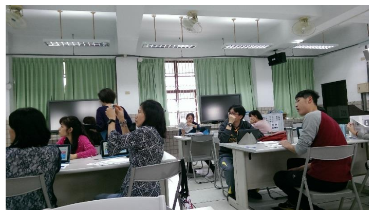
與會老師認真學習操作方式