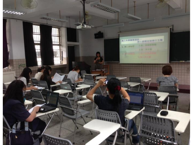
英文科教師共同參與