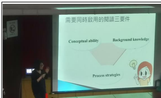
說明：車教授講解閱讀涵蓋之要件