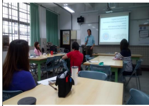
說明：夥伴們聆聽規劃內容並提問