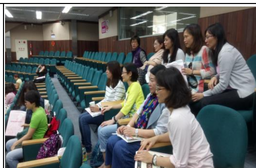
說明：聆聽車教授講授閱讀策略