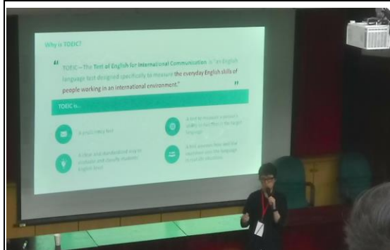
說明：秀帆老師分享選擇考多益之優點