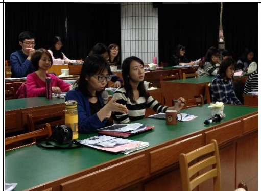
說明：聆聽課綱細則並提問