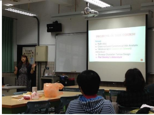
說明：玉屏老師分享課程活動實施規劃