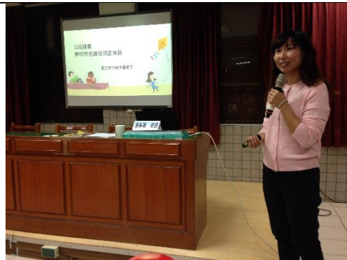
說明：宥基老師講解 108 課綱