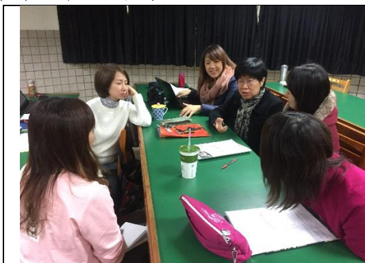
說明：分組討論創意閱讀教學活動