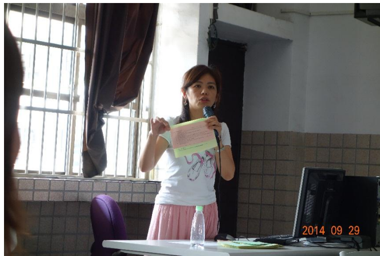
楊玉曲師分享 課堂活動