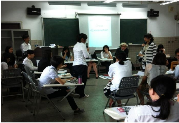
Mock Trial 發表會場