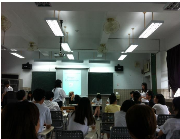
透過角色扮演學習